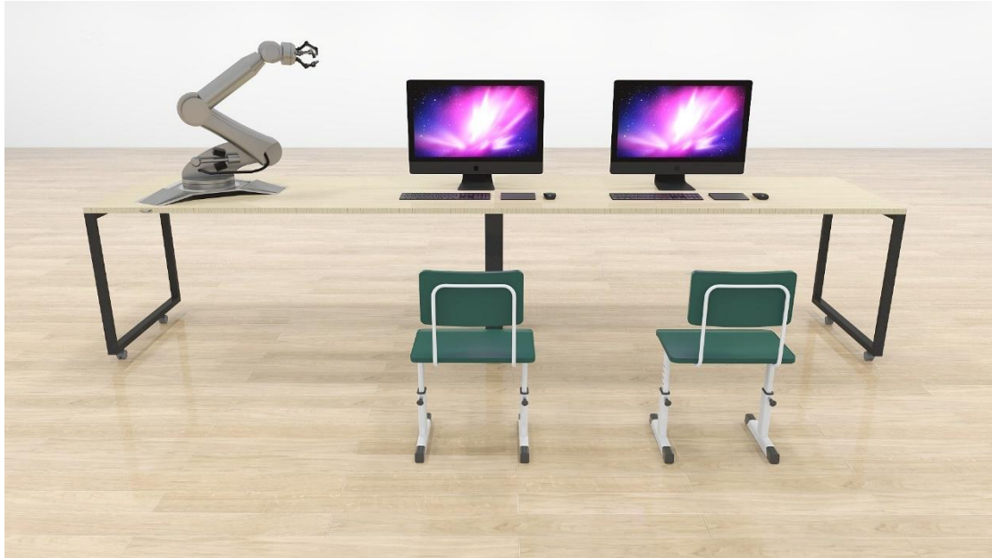
工业产品数字孪生技术平台示意图